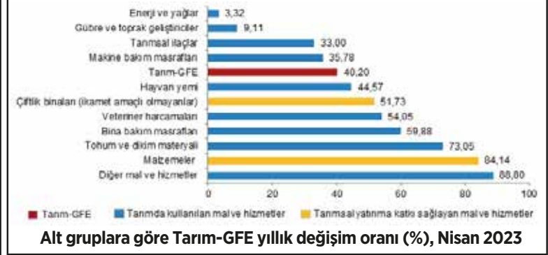
Alt gruplara göre Tarım-GFE yıllık değişim oranı (%), Nisan 2023